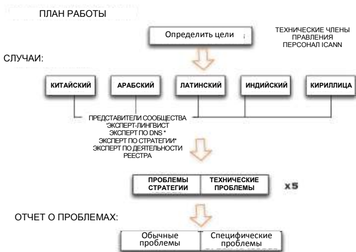
Рис. 1: Рабочий план проекта исследования проблем, связанных с ДВУ с вариантными ИДИ

План разбит на четыре этапа: определить цели, сформировать исследовательские комитеты, провести исследование случаев, синтезировать описание проблем и составить отчет о проблемах. Этапы показаны на рисунке 1.